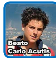
Beato Carlo Acutis