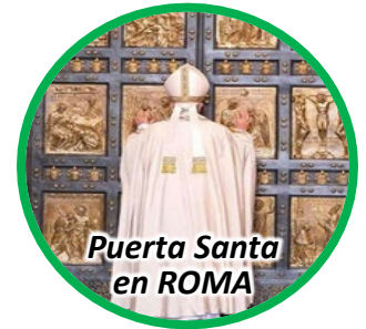
Puerta Santa en ROMA